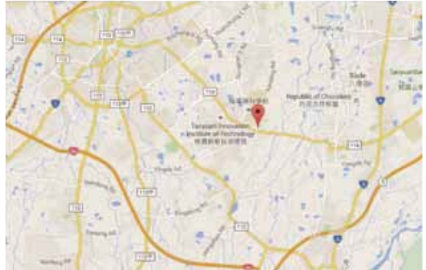
圖3. 霄裡的位置圖。左側今中壢區，右側八德區，霄裡(標記處)在兩區交界處。

找到兩文獻討論馬偕早期成立教會 9,10 。這些於1887年以前成立的教會名單中，拙文