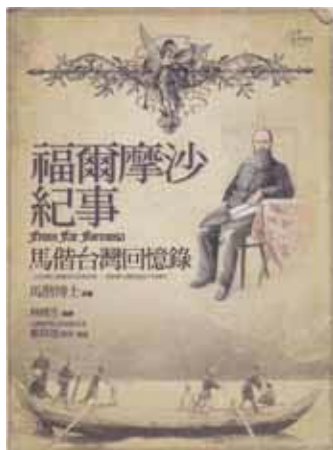
圖1. 福爾摩沙紀事：馬偕台灣回憶錄

灣人分為兩類人種；第一類是原住民，屬於馬來亞人種(Malayan)。第二類是漢人，他們是蒙古人種。漢人中他說「一小部分人的祖先源自於中國北方一個部落，他們後來遷移到廣東省的一些地方，再從那裡橫渡至台灣，這些人叫做客家人，他們具有獨特的生活及語言。」