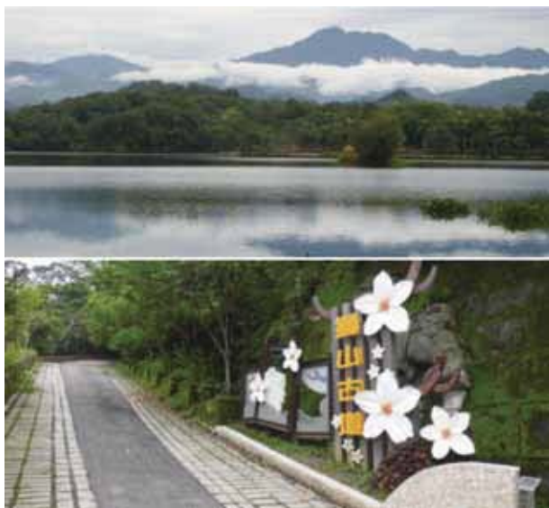
圖4. 峨眉鄉公所官網上的峨眉代表性景色。